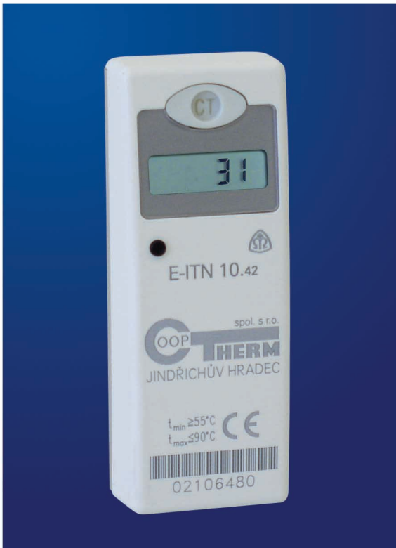
Umístění E-ITN 10.4 na otopném tělese